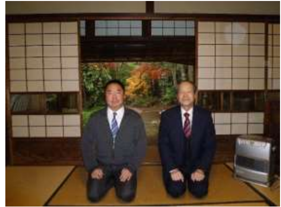
川越市 山屋様にて