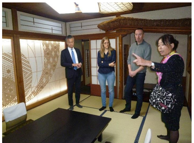
宇喜世様での建物案内

去る11月6日(火)～10日(土)にかけて、フランス旅行会社2社を「百年料亭」へお招きしました。新潟県と山形県へご案内し市内観光と地域文化に触れていただき、更に、百年料亭4軒で料亭料理を堪能されました。上越市では、7日に着物を着付けし、雁木通いを散策しながら古民家喫茶店で休憩し、和菓子店ではとてもきれいで素敵な和菓子を食べながらお菓子について説明を聞きました。また、寺院では「座禅」が殊の外「興味」を示され楽しんでおられました。宇喜世での意見交換で「日本ツアー」を組むときは日本旅行社と手を組んで通訳案内士を依頼している、とのことでした。