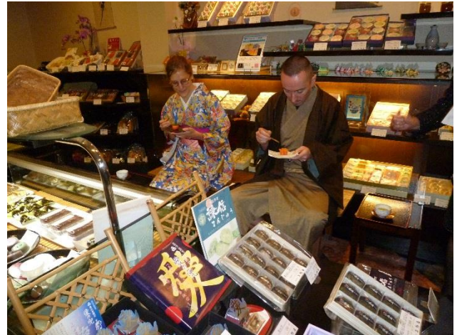
和菓子店様で試食